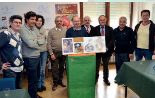
La giuria con le opere premiate

Per maggiori info: www.lacastagnadelsorriso.info